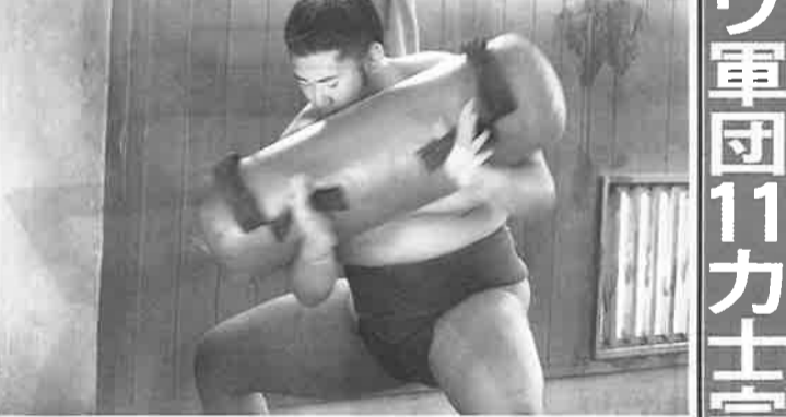
中石 自己最高位の夏勝をマークし、自己最高位になった。入門して5年。徐々に力を付けて、三段目昇進が視界に入っている。「夏場所でもできるだけの力を発揮したい」。腰高の課題は残るものの、今後のさらなる活躍を期している。