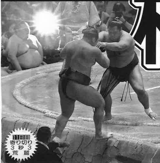
11日目 寄り切り 3秒 荒